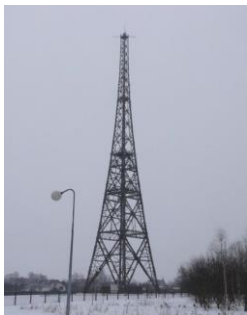
第二次世界大戦の発端 となった、木造の電波塔 ＜ポーランド＞