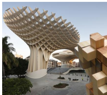
ショッピングモールで 世界最大の木造建築物 ＜スペイン＞