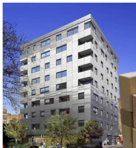
新しい技術で作られた 木造9Fのビル ＜イギリス＞

もし、1や6など同じマス数のブロックが無い場合は1マスはみ出すように積みなければなりません！