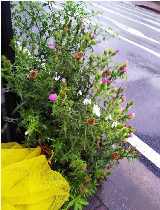
作草部駅前交差点(セブンイレブン側 横断歩道横)