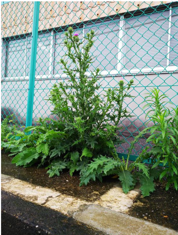
千葉県計量検定所のフェンス沿い