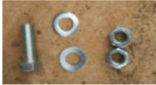
ボルト／ナット／ワッシャー