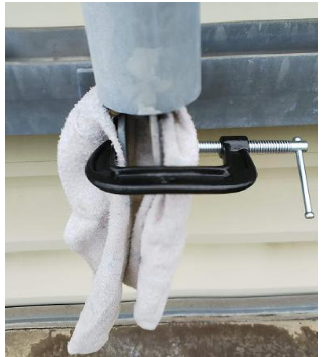
工具：強カクランク ↓ (役立ちました)