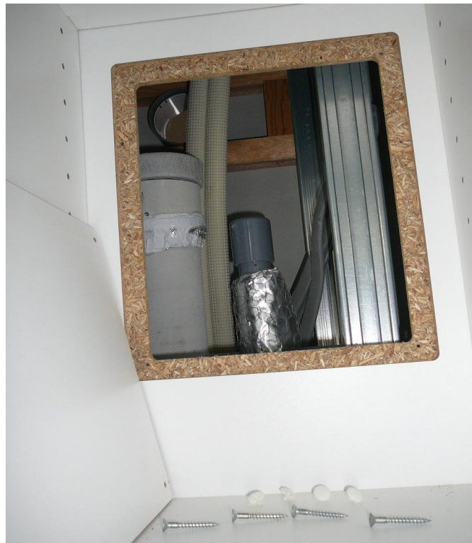
点検口のカバーを外した状態