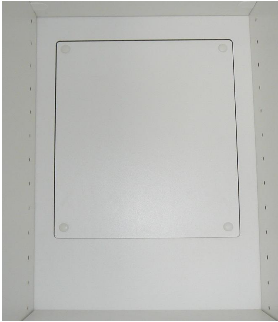
化粧ネジカバーが着いている状況