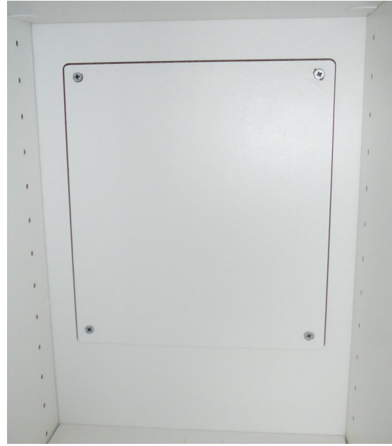
化粧ねじカバーを外した状態