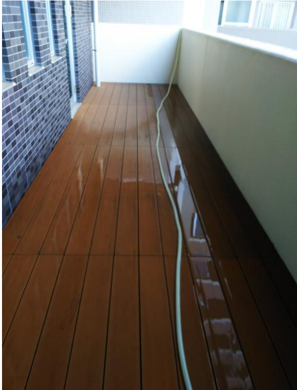
← 共用棟3階 シアタールーム前のウッドデッキ

居住棟4階の階段横「散水栓」より高圧洗浄機に水を供給して作業を実施。「8月27日(木)16:00~19:00」