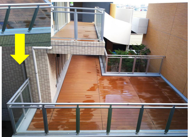
2階キッズルーム前のウッドデッキ →