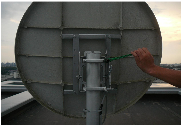
アンテナの方向調整作業