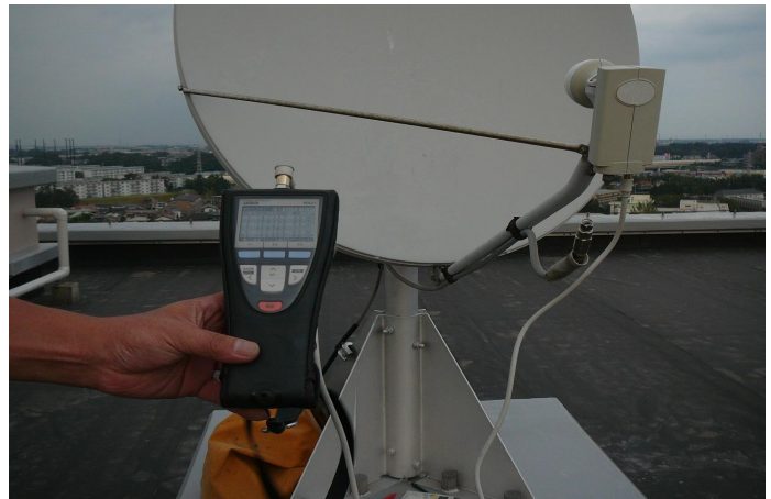
BSアンテナレベル測定