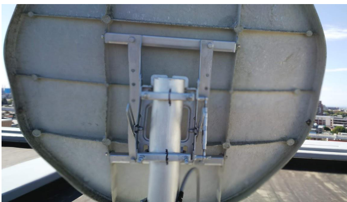
2019年10月09日 台風19号に備え、マーキング

(工事完了報告書では、工事日09月12日(木)となっているが、実際は11日(水)17時ごろ対応)